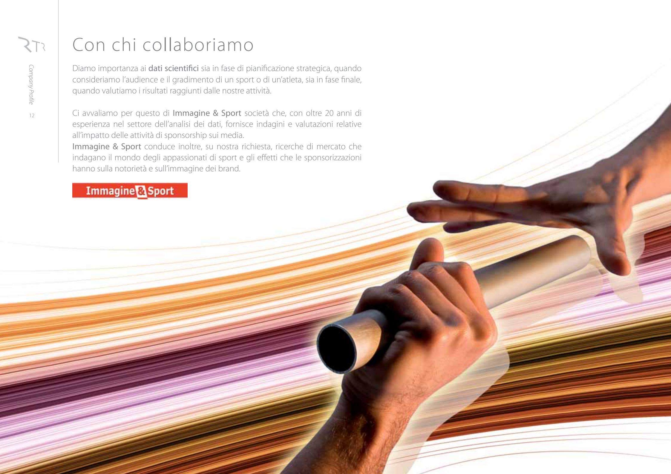
Immagine & Sport

Immagine & Sport conduce inoltre, su nostra richiesta, ricerche di mercato che indagano il mondo degli appassionati di sport e gli effetti che le sponsorizzazioni hanno sulla notorietà e sull'immagine dei brand.